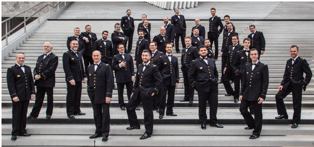
Le Chœur de l'Armée française

Venez écouter au sein du Château de Compiègne les quarante chanteurs professionnels composant cet unique chœur d'hommes professionnel en France !