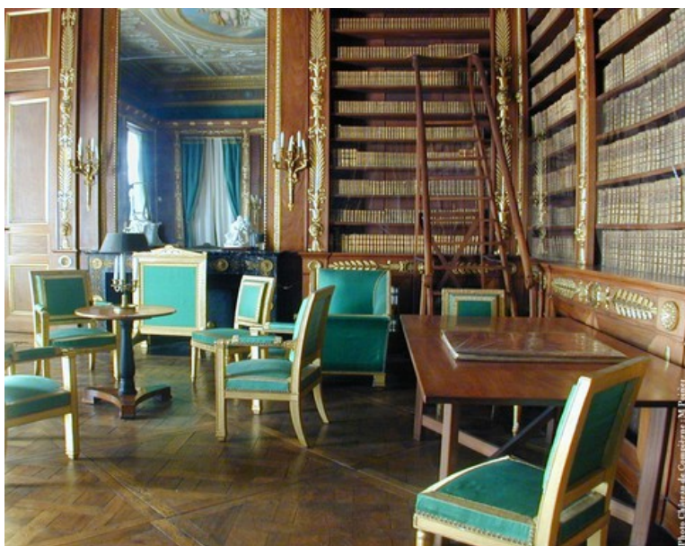
Bibliothèque de l'Empereur