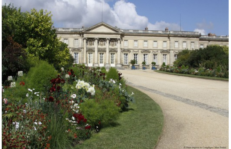
Façade du palais, côté parc

Les travaux commencent en 1751 et sont suffisamment avancés pour permettre à Louis XV d'organiser en 1770 à Compiègne la rencontre entre l'archiduchesse Marie-Antoinette d'Autriche et son fiancé, le dauphin Louis-Auguste. Louis XV ne vit cependant jamais le palais achevé.