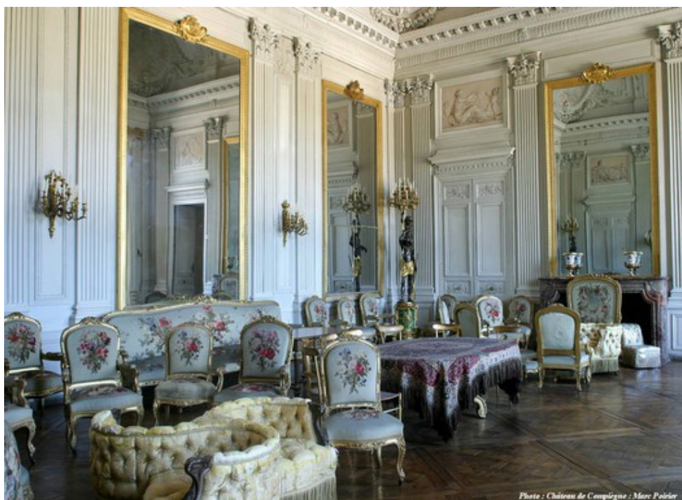
Salon de Famille

Mais loger et distraire une centaine de personnes imposent de nouveaux aménagements. Des appartements d'invités, une Bibliothèque et un Fumoir sont donc créés au deuxième étage tandis que l'impératrice fait redécorer certains salons comme le salon de Musique ou le Salon de Réception selon ses goûts personnels et que l'empereur fait construire la Galerie neuve, dite galerie Natoire* , qui permet d'accéder directement au Grand Théâtre dont il a confié la réalisation, en 1867, à l'architecte Ancelet* . Ce théâtre ne sera jamais achevé, la défaite de Sedan provoquant la chute de l'Empire en 1870.