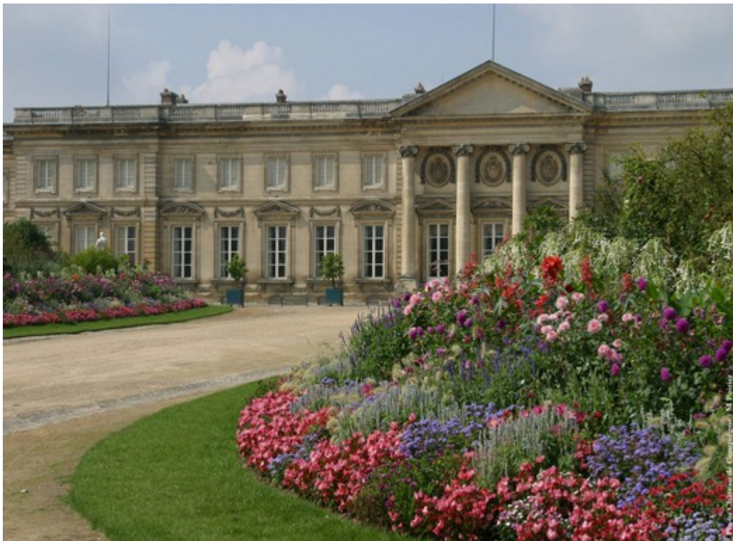
Façade du palais de Compiègne, côté parc