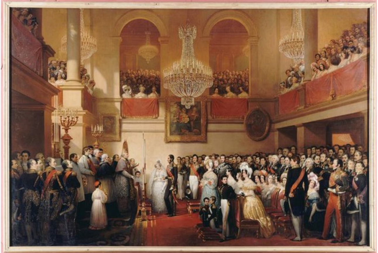
Court, Joseph-Désiré, Le mariage de Léopold, roi des Belges et de Louise d'Orléans, 1837