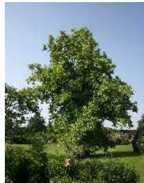
Le tulipier de Virginie Emplacement C + feuille n°1

En vous promenant dans le parc, vous pourrez découvrir beaucoup d'autres arbres intéressants : tilleuls, palmiers, mélèzes ... A vous d'avoir l'œil!