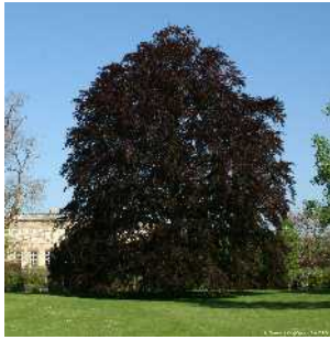
Le hêtre pourpre Emplacement D + feuille n°4