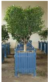
L'oranger Emplacement B + feuille n°2