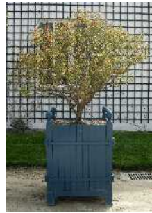
Le grenadier Emplacement A + feuille n°3